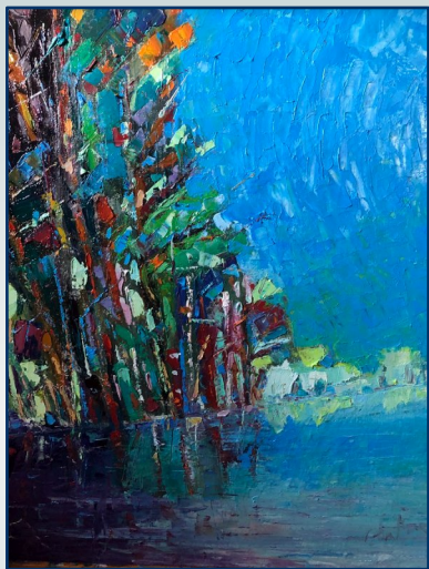
"Drzewa nad Wisłokiem 2017"